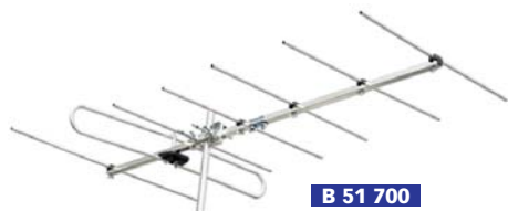
B 51 700