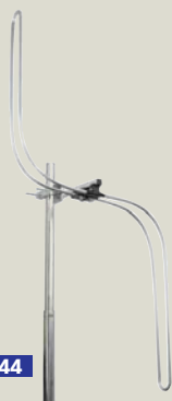
B 50 044