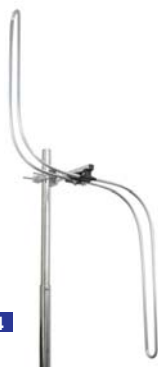
B 50 044