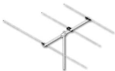
B 40 014